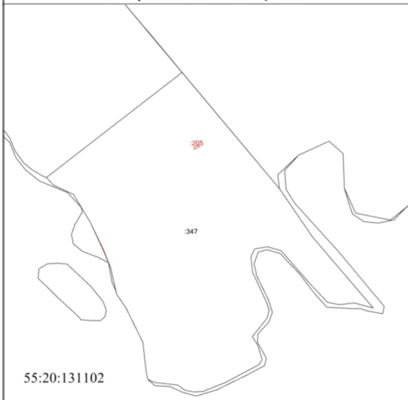
Схема расположения земельных участков